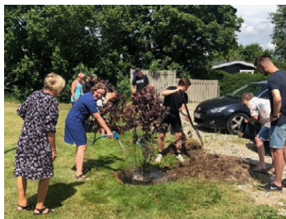
Der plantes træer