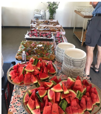
Det store kagebord

Mange af kolonisterne deltog i løbet af dagen, børnene legede og der var tid til hygge, aktiviteter, samvær og dans.